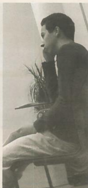
momento de leitura

diz-nos “Este é o meu livro mais otimista. Dos que eu já publiquei é o único que não descreve uma única situação de morte. Aqui só relato nascimento. Nes-